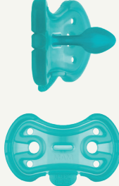
Preemie size 2