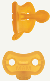
Preemie size 1