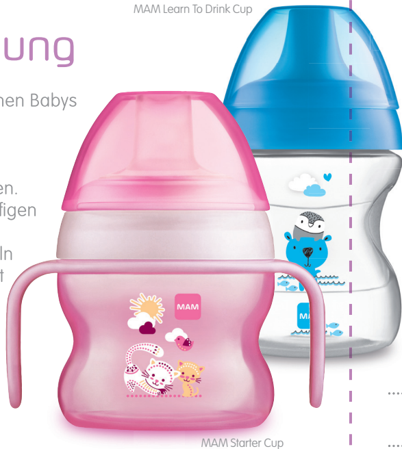
MAM Starter Cup