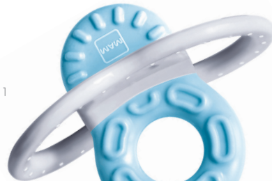
MAM Bite & Relax Phase 1

Was jedes Baby von Natur aus dankbar annimmt, sind Beißringe, denn Kauen und Reibung lindert den Schmerz.