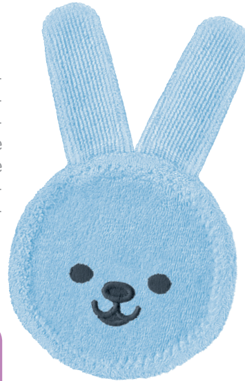
MAM Oral Care Rabbit

Ein weiches Microfasertuch eignet sich am besten, um Babys Mundraum sanft zu reinigen.