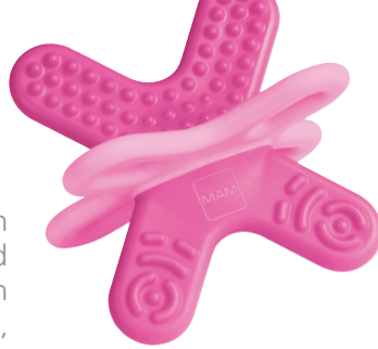
MAM Bite & Relax Phase 2

Die Zeit des Zahnens kann für Babys, aber auch für Eltern Nerven aufreibend sein. Es kribbelt, drückt und juckt und manchmal tut es einfach weh. Milderung schaffen in akuten Fällen eventuell Zäpfchen oder Kräutergels aus der Apotheke, die von Kindern unterschiedlich angenommen werden. Alle diese Mittel (auch homöopathische) sind Medikamente und daher KEINE Dauerlösung.